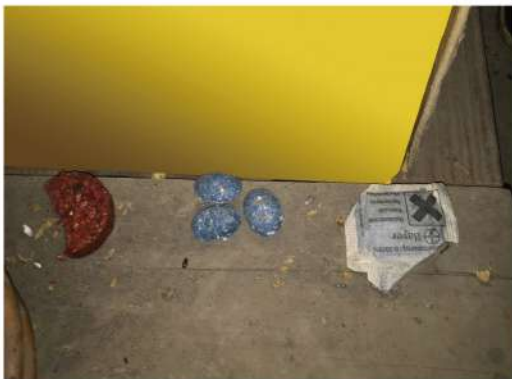
6/3 投置(重新放置一錠鼠)